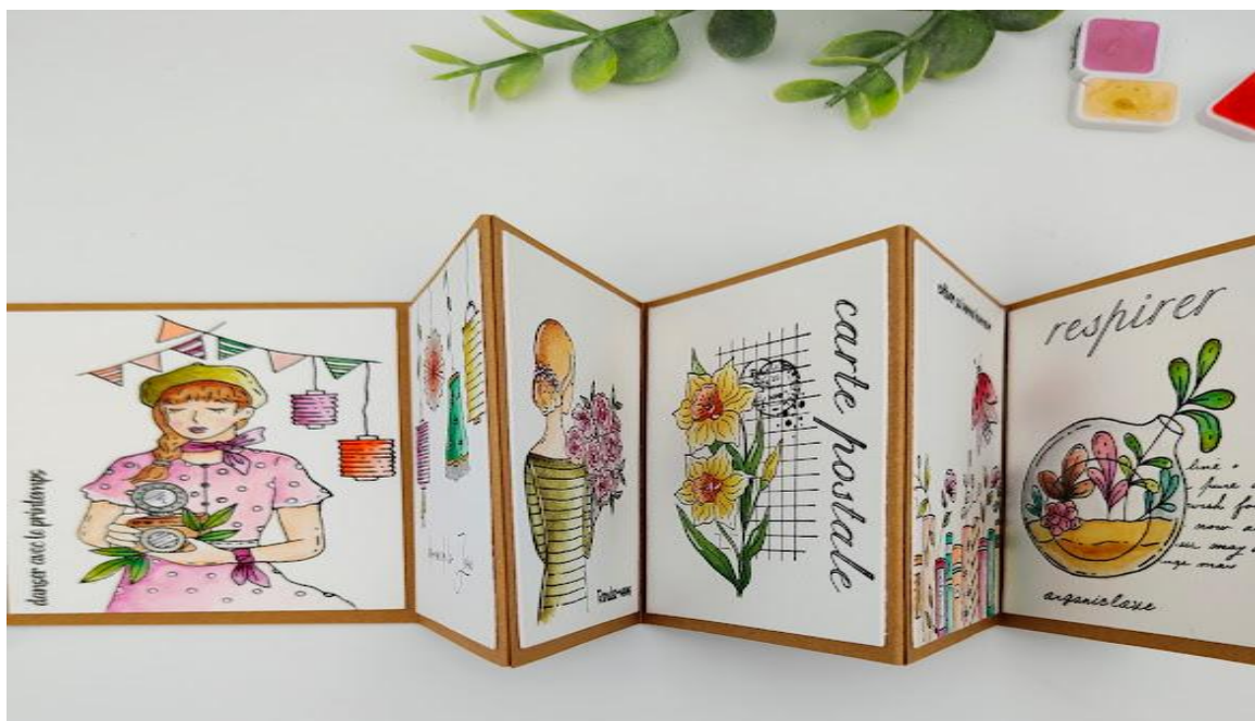
Joyeuses créations par Natyf27.